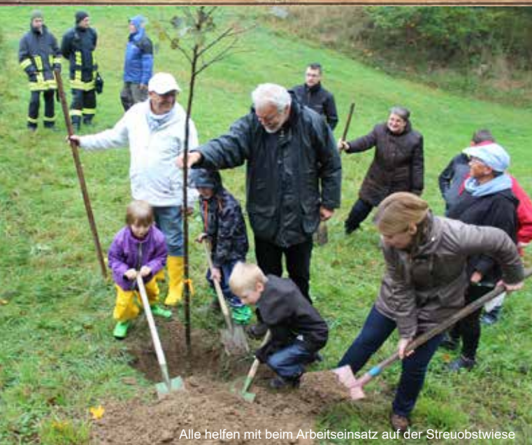
Alle helfen mit beim Arbeitseinsatz auf der Streuobstwiese