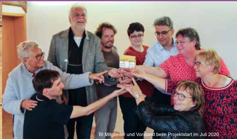
BI Mitglieder und Vorstand beim Projektstart im Juli 2020

▼ Unterstützt unser Projekt auf EcoCrowd